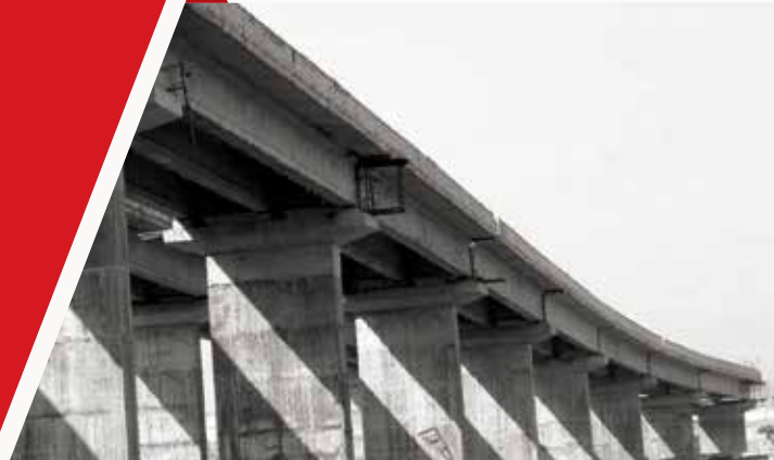
"BRIDGING IDEAS AND TECHNOLOGY"