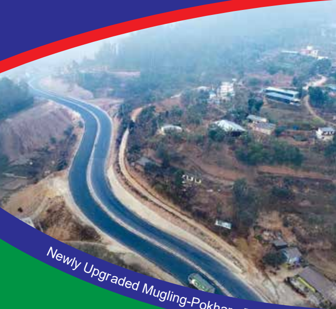
Newly Upgraded Mugling-Pokhara Road Section